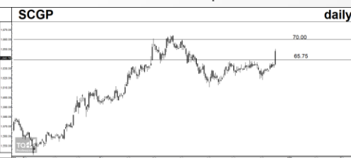
TECHNICAL SIGNAL BUY: PJW