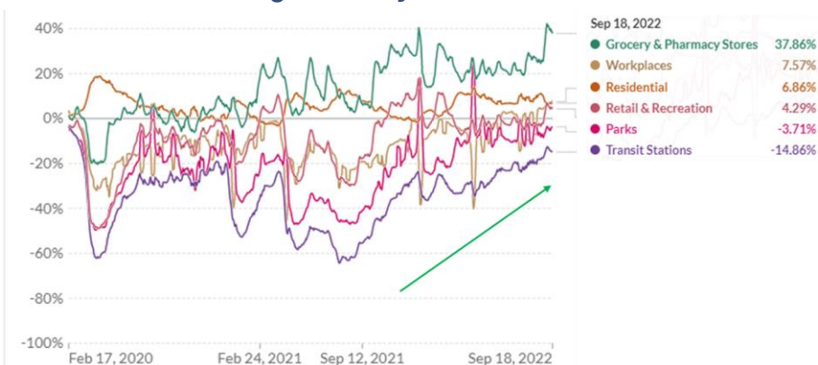
Google Mobility Trend Thailand

นอกจากนี้ เมื่อพิจารณาจาก Google Mobility Trend ของไทย ยังปรับตัวดีขึ้นต่อเนื่อง สะท้อนจากกิจกรรมต่างๆ ปรับตัวขึ้นสูงกว่าช่วงต้นปีทั้งสิ้น มีเพียงสวนสาธารณะ และสถานี่ขนส่งสาธารณะที่ยังอยู่ระดับต่ำกว่าช่วงก่อนเกิด Covid-19 แต่ทิศทางยังเพิ่มขึ้นต่อเนื่องอยู่ ดังรูปด้านล่าง