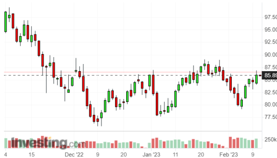
ราคาน้ำมันดิบ Brent

เมื่อวันศุกร์ที่ผ่านมาราคาน้ำมันดิบ Brent พุ่งขึ้นมาราว 2.08% หลังรัสเซียประกาศแผนลดการผลิตน้ำมัน 5 แสนบาร์เรล/วัน ในเดือนมี.ค. 2566 ซึ่งคิดเป็นสัดส่วน 5% ของปริมาณการผลิตทั้งหมด รวมถึงจะไม่จำหน่ายน้ำมันให้แก่ชาติที่เกี่ยวข้องกับการกำหนดเพดานราคาน้ำมันและผลิตภัณฑ์น้ำมันของรัสเซีย