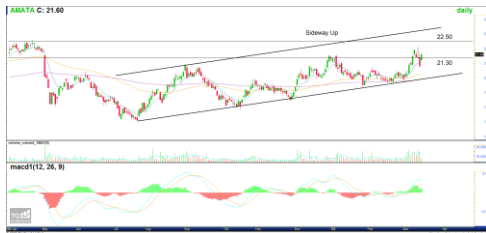
*หมายเหตุ: สำหรับคำแนะนำหุ้นทางเทคนิค หากราคาไม่ถึงเป้าหมายที่กำหนดภายใน 3 วันทำการ แนะนำปิดสถานะเพื่อลดความเสี่ยง