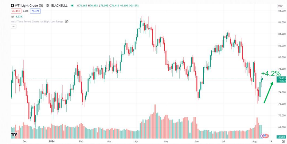
ที่มา: TRADINGVIEW , สายงานวิจัย บล. เอเชีย พลัส