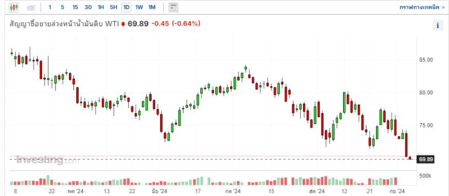
ราคาน้ำมัน WTI ดิ่งทะลุ 70 เหรียญฯ/บาร์เรล