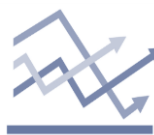
Chart of the day