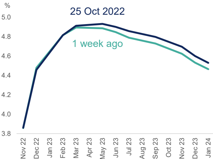
ภาพ 2 : Fed Funds Futures (Implied Rate)

ความเห็น #ทีม IA ในระยะสั้นตลาดหุ้นยังได้รับ sentiment เชิงบวกจากผลประกอบการของบริษัทจดทะเบียนทั่วโลกที่ทยอยรายงานออกมา ซึ่งส่วนใหญ่ยังอยู่ในระดับการขยายตัวที่ดี สอดคล้องกับที่นักวิเคราะห์ได้คาดการณ์การไว้ก่อนหน้านี้อีกว่ากำไรของบริษัทจดทะเบียนส่วนใหญ่จะยังคงขยายตัวได้อย่างต่อเนื่องในไตรมาสนี้ แม้จะชะลอตัวลงกว่าไตรมาสที่ผ่านมาบ้างก็ตาม ดังนั้นหากจบช่วงฤดูกลางประกาศผลประกอบการก็เชื่อว่าตลาดจะเริ่มกลับมาให้ความสำคัญกับตัวเลขเงินเฟ้อและความเข้มงวดของการใช้นโยบายการเงินของธนาคารกลางสหรัฐ (FED) อีกครั้ง ซึ่งปัจจุบันตลาดได้มีการปรับเพิ่มคาดการณ์อัตราดอกเบี้ยนโยบายของ FED ขึ้นจากสี่ปด้าก่อนอีกเล็กน้อย (ภาพที่ 2) ซึ่งปัจจัยดังกล่าวข้างต้นจะส่งผลกระทบต่อราคาสินทรัพย์เสี่ยงในทุกกลุ่มอุตสาหกรรม (เป็นความเสี่ยงเชิงระบบ) ประกอบกับในระยะข้างหน้าวัฏจักรเศรษฐกิจโลกที่กำลังเข้าสู่ช่วง Stagflation จะเป็นช่วงที่กิจกรรมทางเศรษฐกิจจะชะลอตัวและจะส่งผลกระทบต่อผลประกอบการของบริษัทจดทะเบียนในที่สุด ดังนั้นจึงแนะนำถึงกำไร "ในระยะสั้น" ในกลุ่ม Energy ที่ได้ประโยชน์จากราคาพลังงานที่ยังอยู่สูงและคาดการณ์ผลประกอบการที่ยังเติบโต หรือปรับพอร์ตเข้าลงทุนในกลุ่ม Healthcare ที่สามารถปรับราคาค่าบริการตามเงินเฟ้อและผลประกอบการยังคงเติบโตได้ในภาวะดังกล่าว