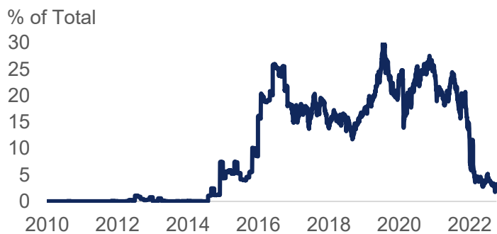
ภาพ 3 : Negative Yield Bond (% of total)

สัปดาห์นี้รอดูประกาศตัวเลขเงินเฟ้อสหรัฐฯ (CPI) คืนวันที่ 10 พ.ย. ตลาดคาด 8%YoY หากออกมามากกว่าคาด มีโอกาสที่เฟดจะยังคงขึ้นดอกเบี้ย 50bps